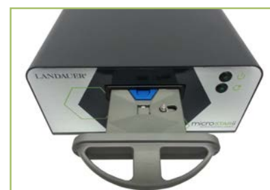
Lecteur microSTARii Tiroir ouvert