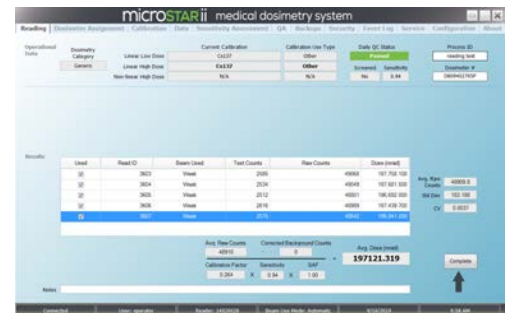
Écran de lecture