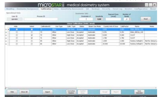
Écran de calibration

Le lecteur de dosimètres microSTAR®ii permet de vérifier la dose reçue. Il ne doit pas être utilisé pour ajuster la dose administrée à un patient.