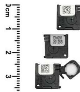
nanoDot Dot pour une mesure de point unique