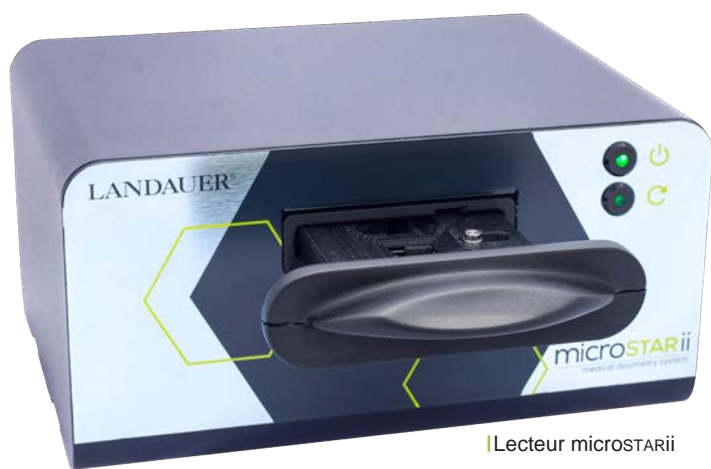
Lecteur microSTAR ii

En radiothérapie et imagerie médicale, la sécurité des patients et des travailleurs est une priorité. Il existe de nombreuses raisons de vérifier de façon indépendante la dose reçue durant un traitement.