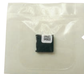
nanoDot dans un sachet en plastique